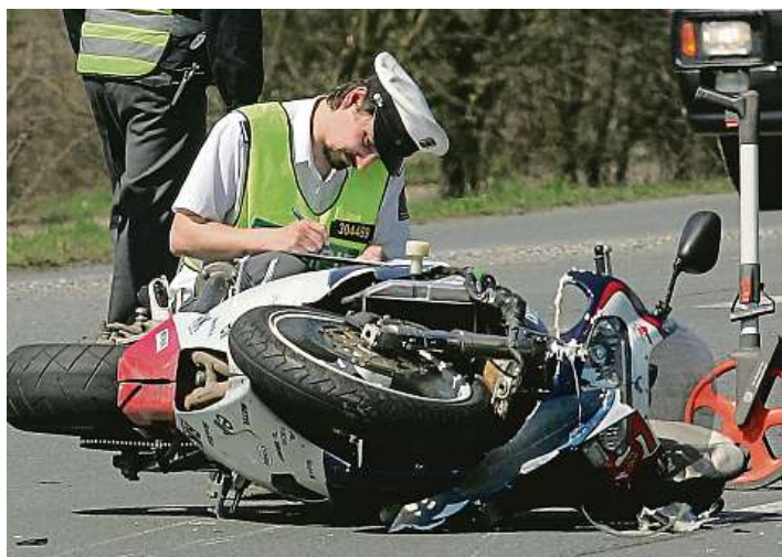
Položil to U nehod motorkářů dojde většinou k poranění hrudníku, dolních a horních končetin. Velké je i riziko poranění páteře.

Právě přílba je v tuzemsku jako jediná povinná, země západní Evropy vyžadují i rukavice nebo ochranné boty. Nejbezpečnější je kožená kombinéza. „V nižších rychlostech může dobré oblečení motorkáři zachránit život a snížit rozsah zranění. V těch vyšších je úplně jedno, co má na sobě, a často umírá na místě. Osobně jsem názoru, že za většinu nehod může právě rychlá jízda a také předpoklad, že motorkář dostane vždy přednost v jízdě od auto-